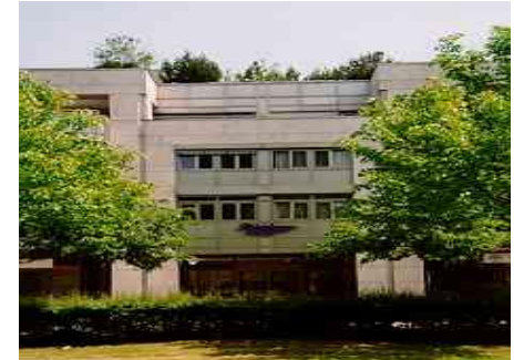
Haupteingang Δ , links neben Parkhotel

Parkplatz vis-à-vis Lift, Überwachungskameras & Securitas-Kontrolle