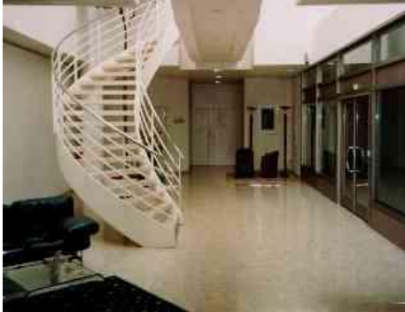
Empfangshalle / Besucher-Lobby

110 qm, kpl. Küche + Archivraum im UG 22 qm + Einstellplatz + Hotelservice + Hallenbad elegante (Gäste- bzw. Firmen-)Wohnung – möbliert/teilmöbliert – Büro, mit oder ohne Archivraum