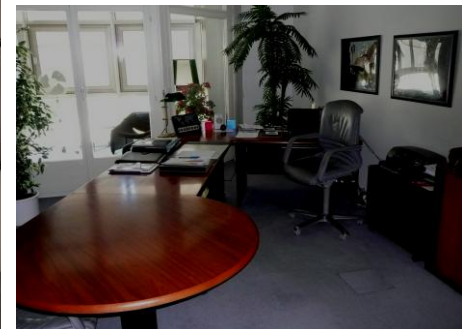
Chefbüro mit Besprechungstisch