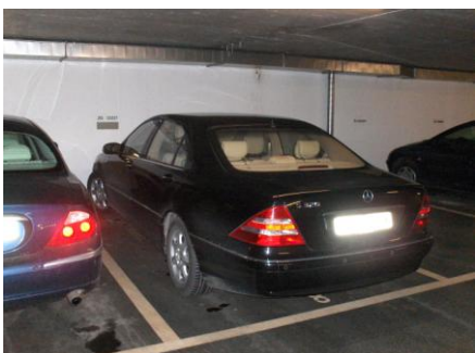
diskreter Zugang von Einstellhalle Δ

Parkplatz vis-à-vis Lift, Überwachungskameras & Securitas-Kontrolle