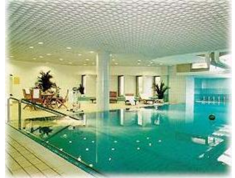
Hallenbad & Sauna