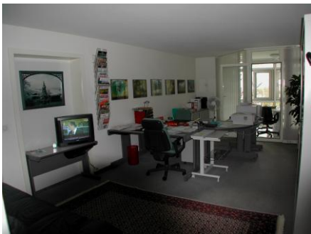
Sekretariat mit 2 Arbeitsplätzen