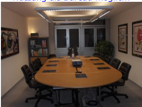
Konferenzraum, 12 Personen mit Präsentationsinfrastruktur