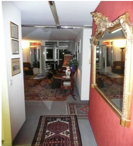
Eingang, 1. Stock